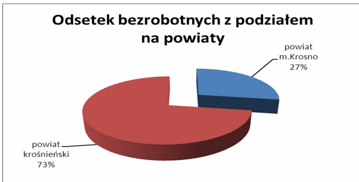
Wykres 2. Odsetek bezrobotnych zarejestrowanych w PUP Krosno z podziałem na powiaty (na koniec czerwca 2014).